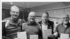
30. Veteranen-Turnier 29.+30. November 2022