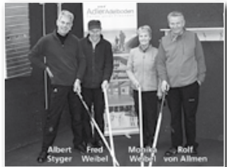
19. Veteranenturnier, Adler Adelboden-Preise 6./7. Dezember 2011 Baden, von Allmen