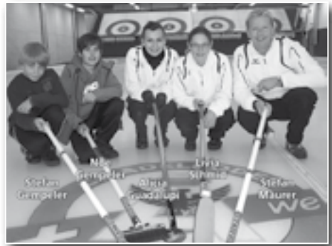
Licht- und Wasserwerk Adelboden AG- und Allround-Garage Künzi-Preise 26./27. Dezember 2011, Adelboden Jun. 1 Maurer