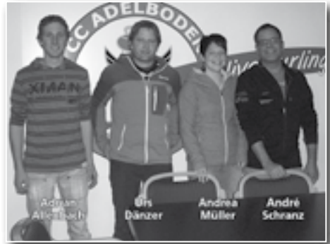
Grümpeturnier 2011 7.–24. November 2011 D'Nölden, Schranz