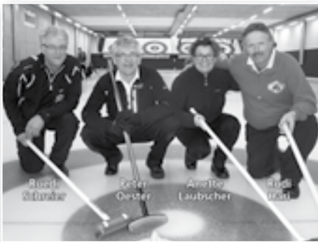
Oester Sport- und Hotel Kreuz-Cup 20./21. Januar 2012 Solothurn, Hari