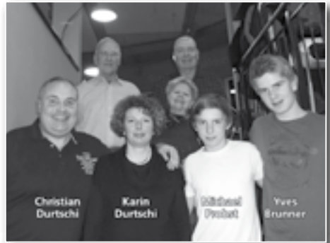
3. Kurioses Bärzelstagsturnier 2. Januar 2012 LBEWO, Durtschi