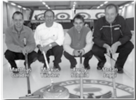
Rest. Alpenblick- und Viktoria Eden-Preise 22./23. Oktober 2011 Schönried, Jaggi