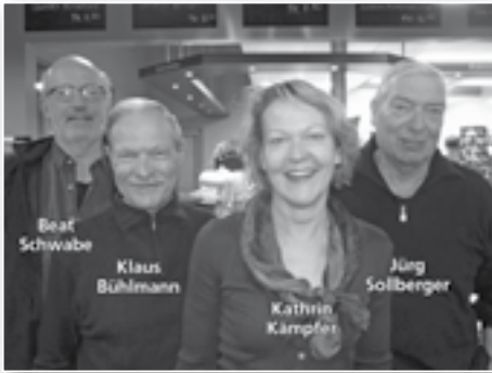
Altjahrs-Cup 29./30. Dezember 2011 Yschblueme, Bühlmann