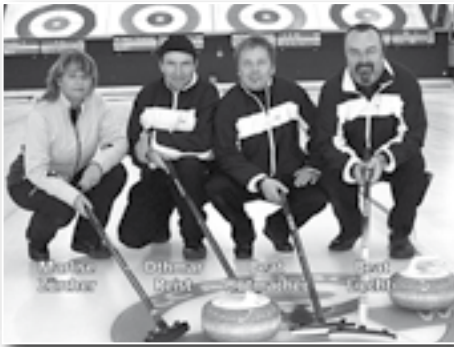
Hotel Crystal-, Vins Testuz- und Die Mobiliar-Preise 17./18. Dezember 2011 CC Bern Crystal, Liechti