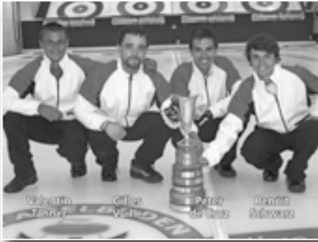
41. Grosses Sommerturnier 26.–28. August 2011 CC Genève, de Cruz